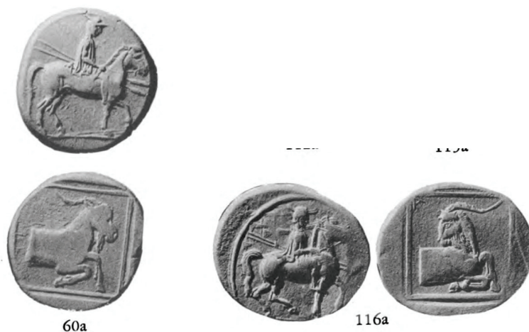
Приложение 4. Изображение коз на монетах Александра I. Источник: Raymond, D. (1953) Macedonian Royal Coinage to 413 B. C. New York. Plate. IX, X.

Источник: Артамонов, М. И. (1966) Сокровища скифских курганов в собраниях Государственного Эрмитажа . Прага.