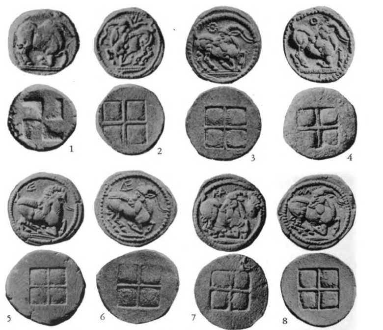
Приложение 1. Фрако-македонские статеры.