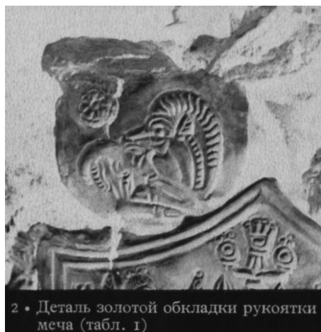
2 • Деталь золотой обкладки рукоятки меча (табл. 1)