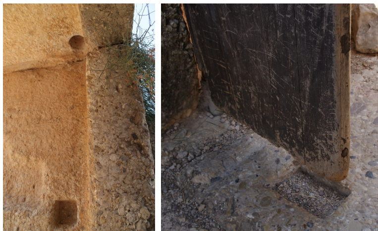
Рис. 2. Распашные ворота в Микенах. На изображении хорошо виден способ их крепления, а также расположение двух засовов, поперечного, который, очевидно, запирает обе створки одновременно, и двух вертикальных, фиксирующих створки снизу

имение мужского рода и вся фраза относится к заблуждающимся людям. Если же имеются в виду все вещи, то можно подумать и о космических циклах, тем более, что этот аспект космологии Парменида совершенно не ясен. Например, можно предположить, что по мнению философа путь познания прямой, тогда как в физическом мире все изменяется (то есть «есть и не есть» одновременно) и постоянно возвращается на круги своя. Грэхэм полагает, что двусмысленность в этой фразе Парменидом допущена намеренно (Graham 2010, 215).