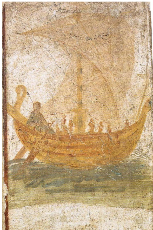
Рис. 5. Фреска из дома моряка или купца по имени Лесбиан (Музей «Антиквариум» в Боскореале). На фреске изображен торговый корабль в открытом море, идущий полным курсом по отношению к ветру. На море умеренное волнение. Команда работает со снастями у мачты, вручив рулевые весла крупной женской фигуре, несущей скипетр, которая может быть идентифицирована с Афродитой на основании еле заметной надписи под судном: «Aphrodeite Sozousa».