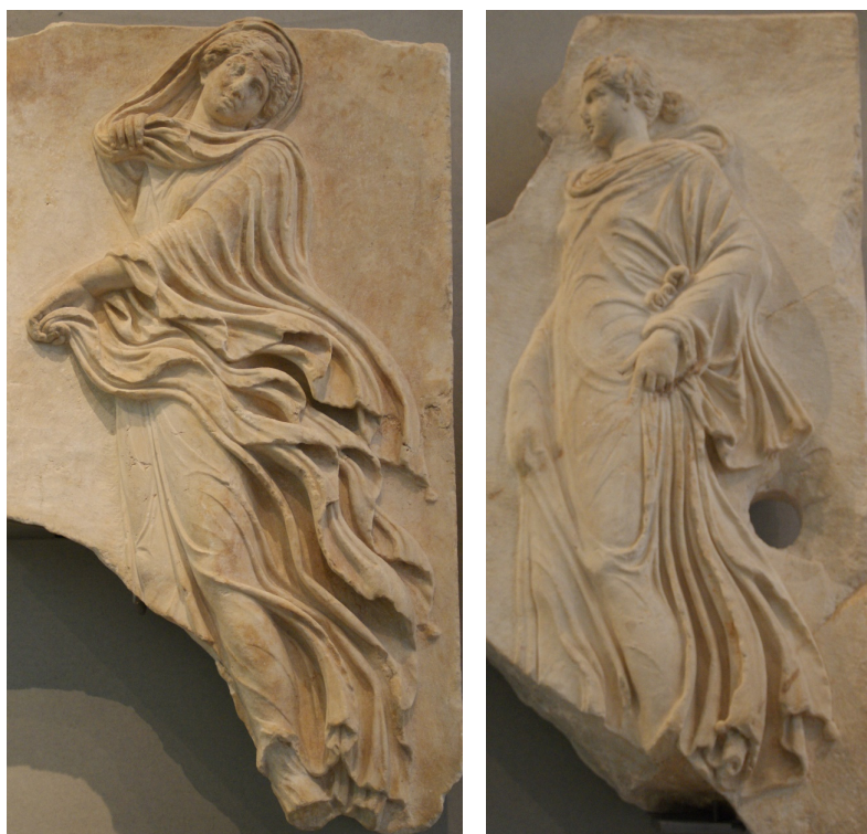
Рис. 3. Горы (дочери Зевса и Фемиды). Музей Акрополя, Афины

характеристике подлинной действительности еще одно важное свойство, существенно отличное от остальных трех, будь то его «неспособность к размножению» или безвременность. Действительно, бытие, будучи само не родившемся и не гибнущим, не может ведь породить какое-то еще бытие, так чтобы стало два бытия, и поэтому оно конечно же должно быть единственным в своем роде (о чем говорится в строке 6 фрагмента, ниже) и обладать такой негативной характеристикой как бесплодие.