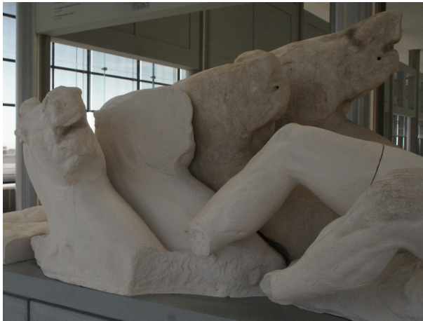
Рис. 1. Четыре кобылицы и колесница Гелиоса, «восходящего» на небосклон из волн Океана (вверху: фронтоны Парфенона, внизу: скульптуры из Музея Акрополя, Афины). Эта крайняя левая скульптурная группа восточного фронтона Парфенона справа на том же фронтоны дополняется скульптурным изображением Селены (Луны) и ее колесницы, исчезающей за горизонтом